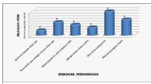
Rajah 1: Bilangan Item bagi Kerangka Utama Perundingan dalam Lima Perjanjian pada Zaman Rasulullah (s.a.w)

Merujuk kepada Rajah 1 terdapat enam (6) kerangka yang dikenalpasti dalam menganalisa kerangka perundingan terhadap perjanjian yang dijalankan pada zaman Rasulullah (s.a.w). Berdasarkan unit pengiraan, kajian mendapati bahawa kerangka yang paling banyak dimeterai dalam kesemua perjanjian ialah kerangka yang kelima iaitu menindas kekejaman, mencegah kemungkaran dan jenayah sesama penduduk iaitu sebanyak sembilan item bersamaan dengan 31% dari jumlah keseluruhan item (29 item). Ini diikuti pula dengan kerangka yang keenam iaitu memperjuangkan Islam dan penguatkuasaan gencatan senjata iaitu enam item sahaja (21%). Manakala kerangka kelima yang menyebut bahawasanya Rasulullah (s.a.w) sebagai utusan Allah (s.w.t) dan juga pemimpin negara terdapat lima item kesemuanya (17%). Terdapat tiga kerangka lain yang mendapat nilai yang agak rendah iaitu: (1) Kerangka pertama iaitu beriman kepada Allah (s.w.t) yang Maha Esa (dua item atau 7%), (2) Kerangka ketiga iaitu bekerjasama ke arah kebaikan, membangunkan ekonomi negara, memudahkan pengurusan perniagaan atau perdagangan (empat item atau 14%), (3) Kerangka keempat iaitu mengeratkan silaturrahim, persahabatan atau kejiranan (tiga item atau 10%).